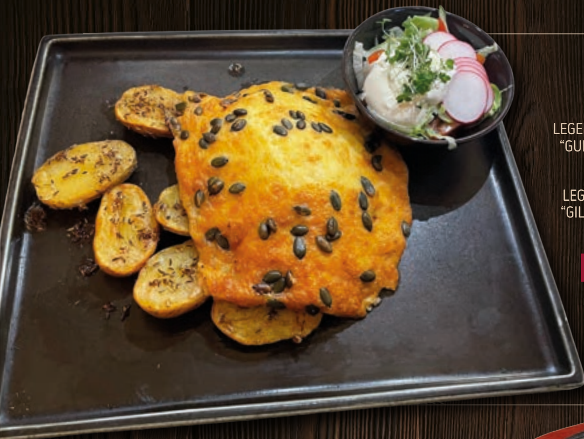
LEGENDARY KAUNAS'S "GUILD" BEEF STEAK