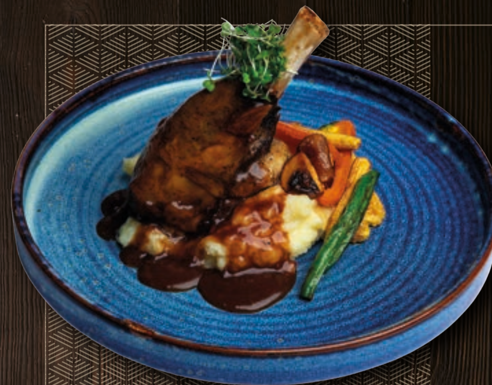
LAMB SHANK AVIENOS BLAUZDA